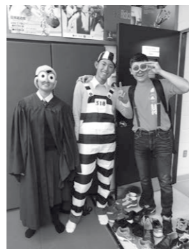
ハロウィンイベント