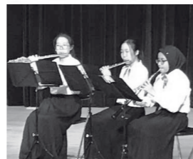
マレーシア校訪問交流